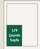
11 x 15 cm