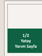
22 x 15 cm